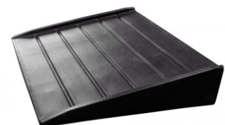
Rampa umożliwia łatwe przemieszczenie beczki na paletę.