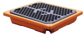
Podłoga robocza pod jedną beczkę

Podłogi robocze to rodzaj palet przystosowany do łączenia w większe obszary robocze, za pomocą specjalnych zaczepów.