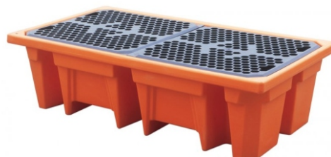
Paleta pod dwie beczki

Palety wychwytnące pod beczki są przeznaczone do składowania pojemników z substancjami chemicznymi w zakładach produkcyjnych, magazynach, gospodarstwach rolnych, zajezdniach, portach, warsztatach itp. Zapobiegają one również rozlewaniu substancji chemicznych podczas opróżniania lub napełniania beczek. Wyprofilowane dno palety umożliwia przetransportowanie jej za pomocą wózka widłowego.