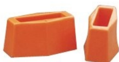
Zaczepy umożliwiają łączenie podłóg roboczych.