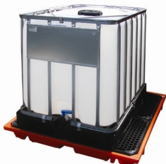
Podłoga robocza pod pojemnikiem IBC