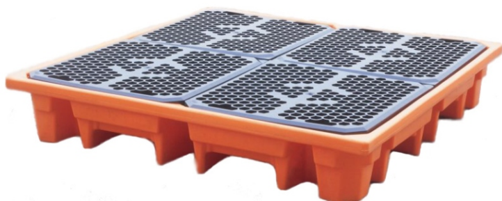
Paleta pod cztery beczki