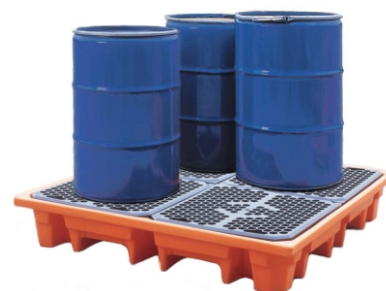
Paleta pod cztery beczki w zastosowaniu