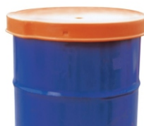
Pokrywa na beczkę