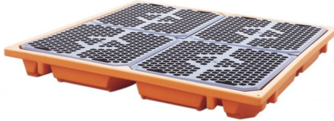
Podłoga robocza pod cztery beczki